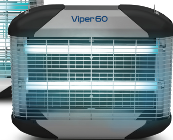
Viper 60 Catcher Insektenlichtfalle mit 4x15W