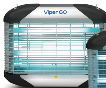
Viper 60 Killer Insektenlichtfalle mit 4x15W Röhren